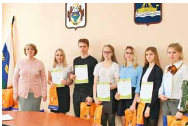
Награждение участников конкурса, 2017 год

Департамент, в свою очередь, продолжит просвещать и информировать потребителей об их правах, о необходимых действиях по защите этих прав, а также оказывать консультационную помощь по вопросам защиты потребительских прав граждан.