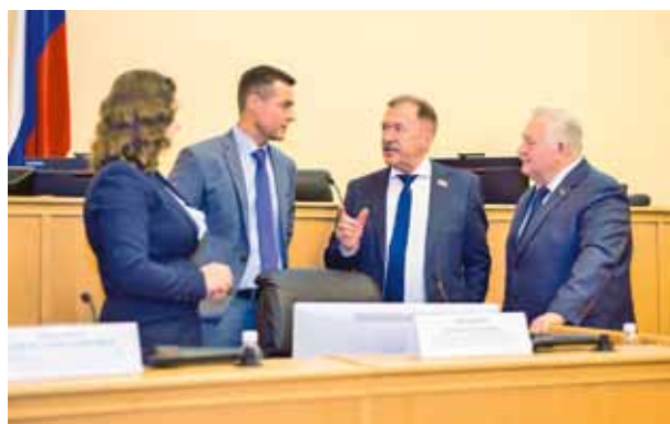
Финал конкурса «Юрист-профессионал — 2022»

Приглашаю юристов и студентов Тюменской области, Ханты-Мансийского автономного округа – Югры и Ямало-Ненецкого автономного округа, обучающихся в вузах по специальностям юридической направленности, принять участие в XVIII Тюменском областном конкурсе «Юрист-профессионал Тюменской области!» Будем рады видеть вас! Всем успехов!