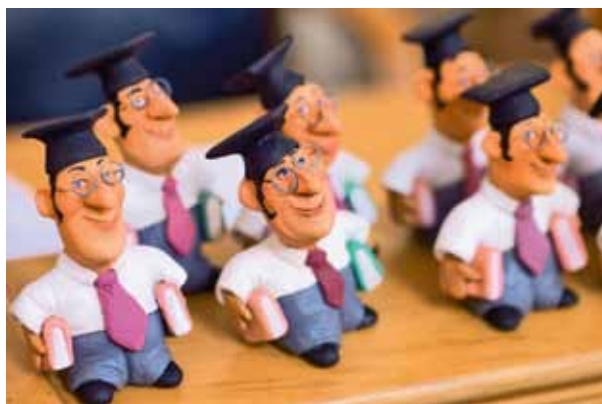
Авторские фигурки для финалистов конкурса