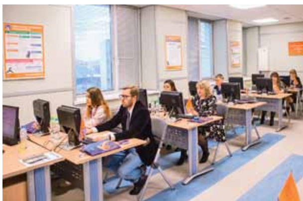
Финал конкурса «Юрист-профессионал – 2022»

Подводя итог сказанному, процитирую слова древнеримского политического деятеля, оратора и философа Марка Туллия Цицерона: «Знание законов заключается не в том, чтобы помнить их слова, а в том, чтобы постигать их смысл».